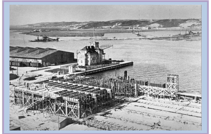
Budowa portu morskiego w Gdyni.