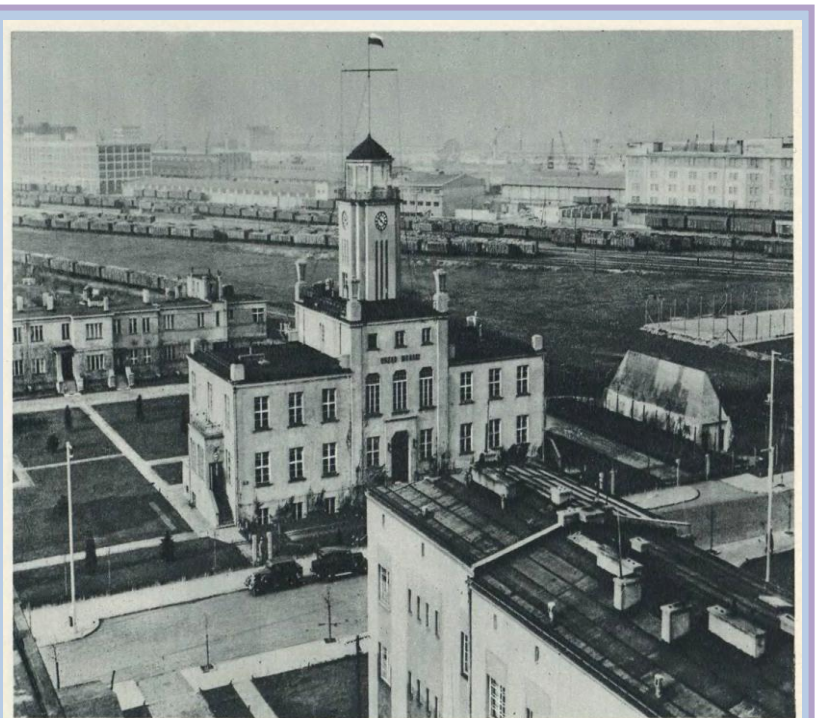
Gdynia 1926 rok