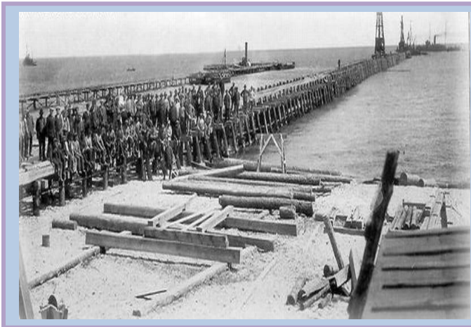
Tymczasowa przystań dla okrętów MW.”