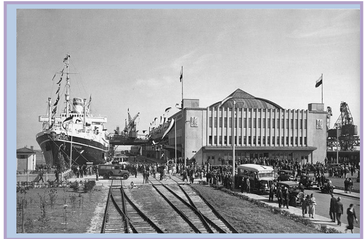
MS Piłsudski przy Dworcu Morskim