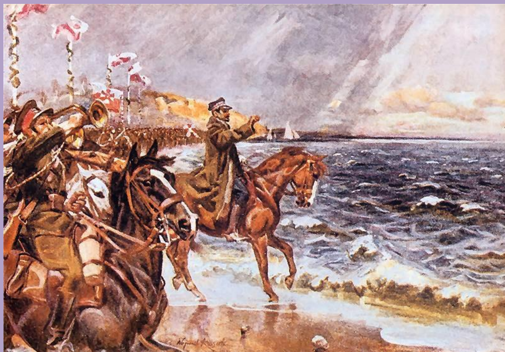
Obraz Zaślubiny Polski z Bałtykiem autorstwa Wojciecha Kossaka