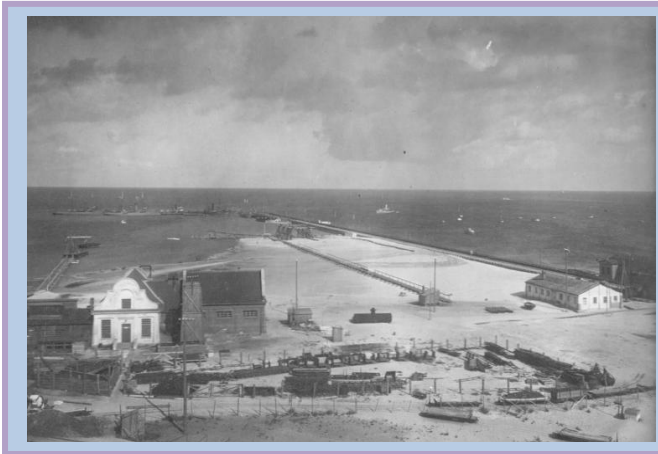
Budowa portu morskiego w Gdyni. 1925 r.

3. Dnia 29 kwietnia 1923 r. z udziałem prezydenta RP Stanisława Wojciechowskiego i premiera Władysława Sikorskiego odbyło się w Gdyni uroczyste otwarcie Tymczasowego Portu Wojennego i Schroniska dla Rybaków.